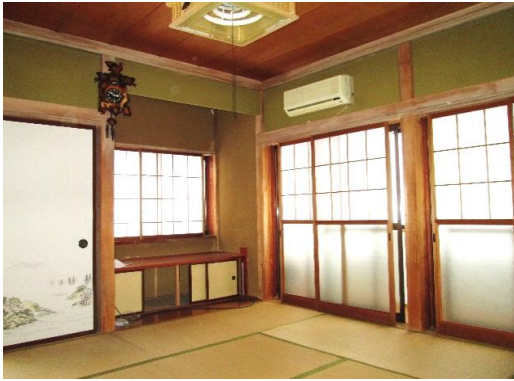
1階 和室 (8畳)