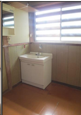
洗面所・洗濯機置